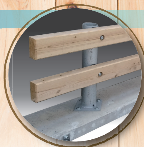
ウッドバリ(標準タイプ)